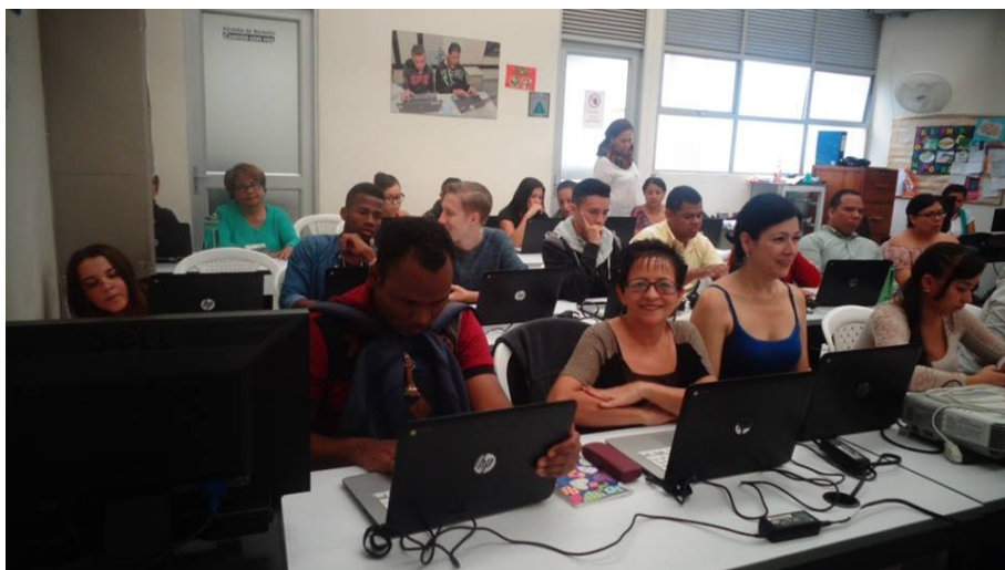
Utbildning för barnhemmets personal

Rapport för perioden okt 2018 – jan 2019