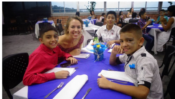
25-årsjubileum av "Jucum Misericordia Medellin"