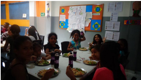
Avskedsfest för barnen inför jullovet.